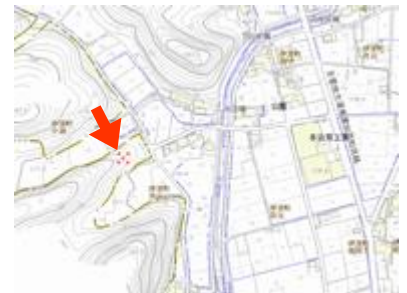
標柱あり(会元橋西約100m)

安土桃山時代の武将。近江出身。織田信長に仕えた役人として筆頭格。信長が上洛してからは京都の民政に携わった。1573年からは京都所司代の要職にあり、1575年長門守に任ぜられた。本能寺の変のとき、信長の嫡子信忠に殉じ二条御所で討死した。